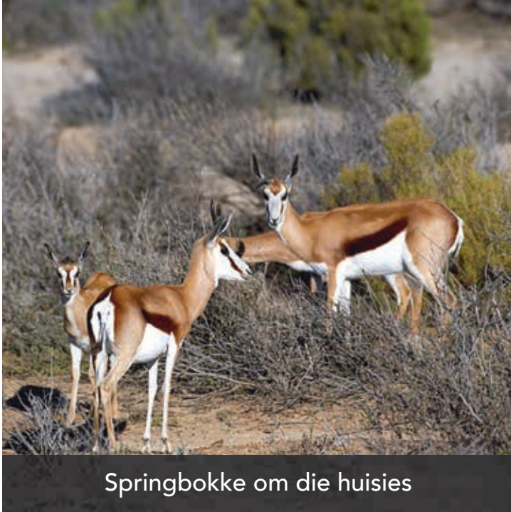
Springbokke om die huisies

EL YOLO OnE is 'n driestêr gasteplaas, met selfsorg akkommodasie, in privaat besit, wat op die grens tussen die Weskaap en die Ooskaap geleë is. Hier kan jy ontspan, die natuur geniet, plaaslewe, 4x4 roetes en baie meer.