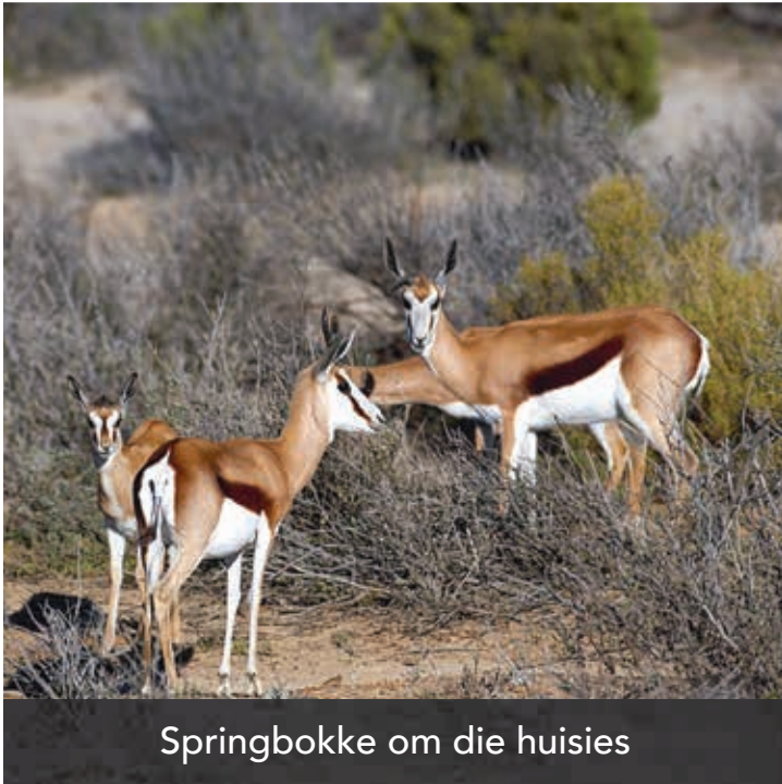
Springbokke om die huisies

EL YOLO OnE is 'n driestêr gasteplaas, met selfsorg akkommodasie, in privaat besit, wat op die grens tussen die Weskaap en die Ooskaap geleë is. Hier kan jy ontspan, die natuur geniet, plaaslewe, 4x4 roetes en baie meer.