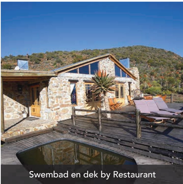
Swembad en dek by Restaurant

Die naaste dorpie is Klaarstroom, naby Meiringspoort, een van die agt wêreld erfenis gebiede in Suid Afrika. EL YOLO OnE is ook net 'n paar kilometer vanaf Willowmore en die asemrowende Baviaanskloof. Selfs Prins Albert, De Rust en Oudtshoorn kan op 'n dagbesoek, vanaf EL YOLO OnE besoek word.