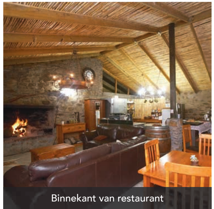
Binnekant van restaurant